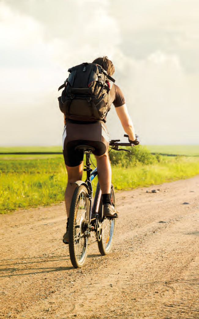
Na EuroVelo 13 na cyklisty čekají rušná města i nekonečné přírodní stezky lemované poli a kopci

Slavonice Fest V srpnu se ve Slavonicích nedaleko Jindřichova Hradce koná letní filmový a hudební festival (letos naplánovaný na 4. – 8. srpna). Festival je jako stvořený na malou přestávku na cyklo dovolené. Jeho součástí jsou koncerty, letní kina, filmové projekce, vernisáže, diskuze atd. Více informací a doporučení na ubytování najdete na slavonicefest.cz .