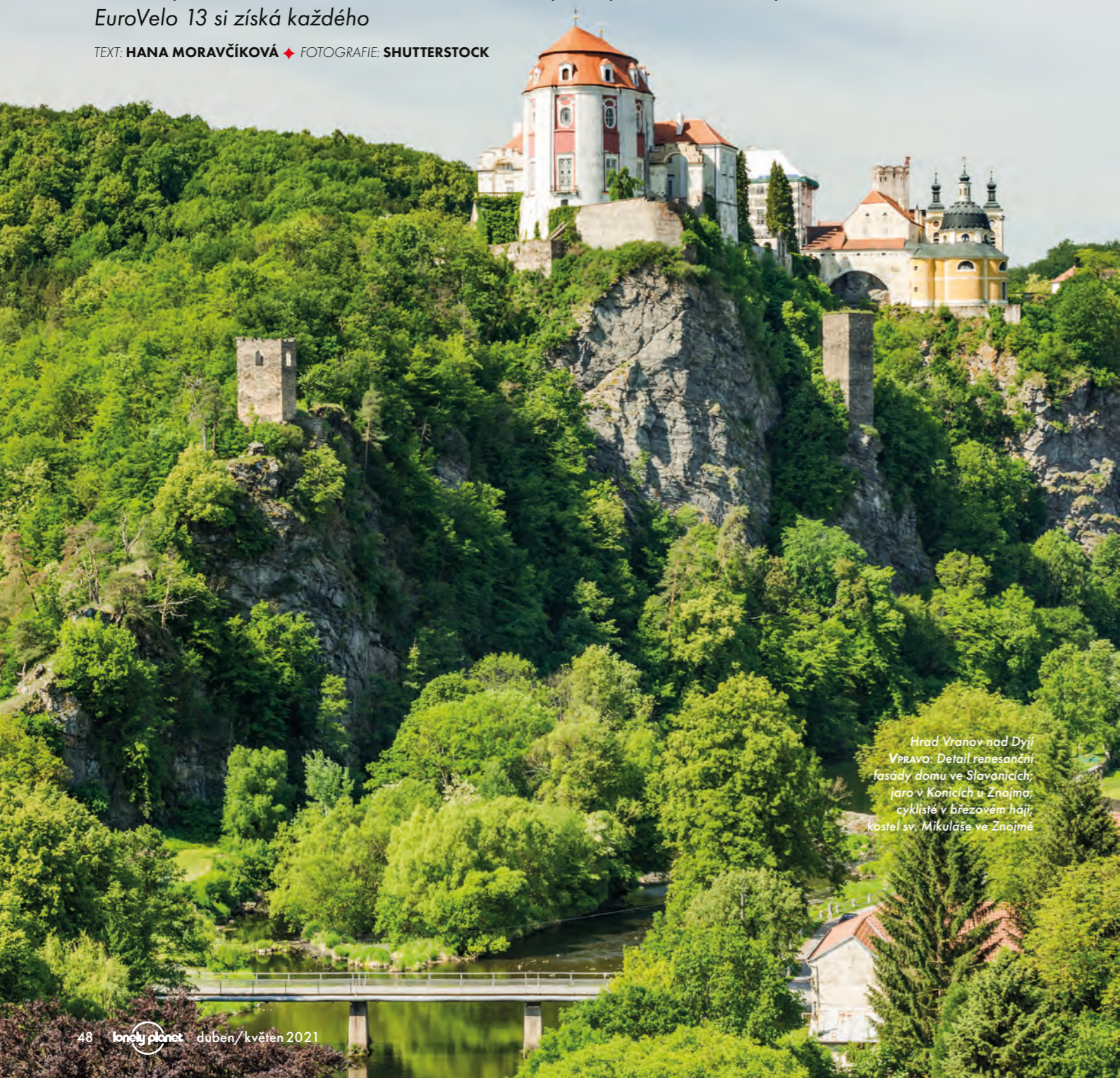
Hrad Vranov nad Dyjí VPRAVO: Detail renesanční fasády domu ve Slavonicích; jaro v Konicích u Znojma; cyklisté v březovém háji; kostel sv. Mikuláše ve Znojmě

TEXT: HANA MORAVČIKOVÁ