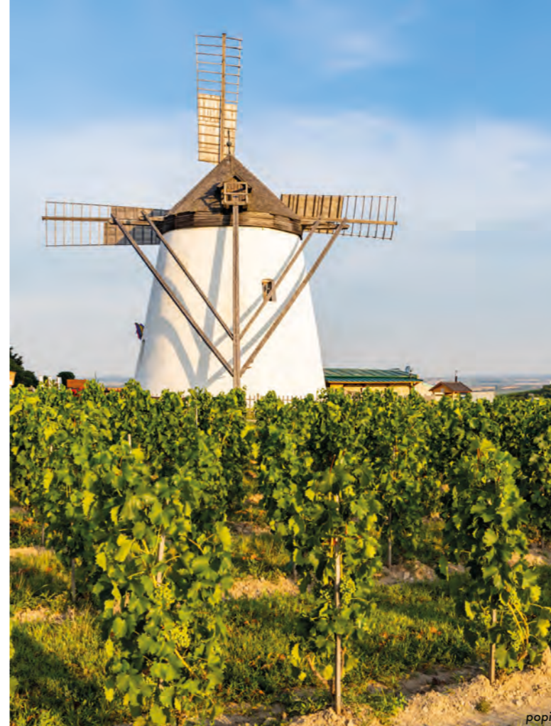
Sluncem zalitá Bratislava s Dunajem VPRAVO: Mlýn uprostřed vinic v Retzi; paragliding nad Pálavou; tradiční stáčení vína na Moravě; pálavské vinice

Valtický okruh Pokud vám ve Valticích zbyde čas, podívejte se na samostatnou cyklotrasu Valtický okruh. Je to pohodový 18kilometrový výlet, během něhož budete sledovat červenou a modrou turistickou trasu. Podíváte se na něm na Valtice, Kolonádu, Úvaly, Sedlec, k rybníku Nesyt, do Hlohovce a pak se dostanete zpátky do Valtic. Informace o dalších cyklotrasách vedoucích přes Valtice najdete na valtice.eu .