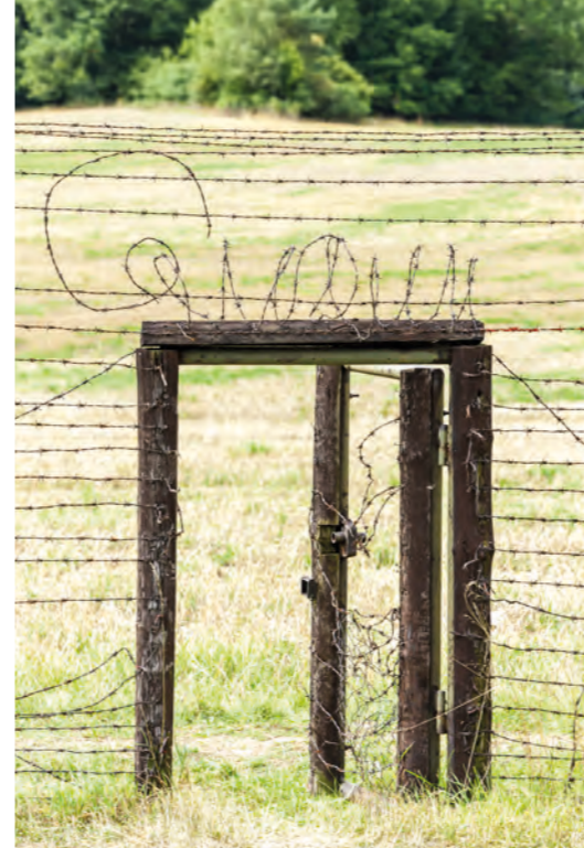
ZLEVA: Průchod v železné oponě v Čížově; Volavka na Dunaji; hrad Děvín, 5 km od Bratislavy

Třetí den na EV 13 se nesl ve zvláštní náladě... Z obou stran jsem během několika hodin třikrát křížovala hranice mezi Rakouskem a Českem